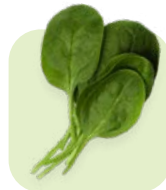
Espinaca Baby Spinach Corte / cut: