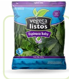
Espinaca Baby Spinach Baby Corte/cut: