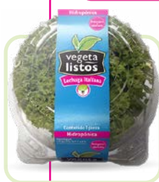
Lechuga Hidropónica Italiana Hydroponic Lettuce Italian Corte/cut: