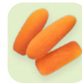
Zanahoria Body Baby Carrot Selección Selection