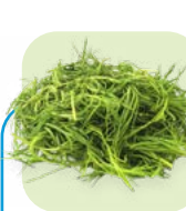
Romeritos Romeritos Corte/cut: