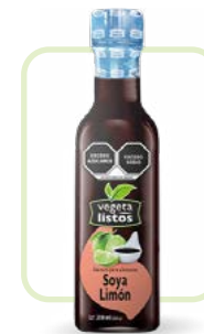
Aderezo Soya - Limón