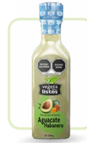
Aderezo Aguacate Habanero