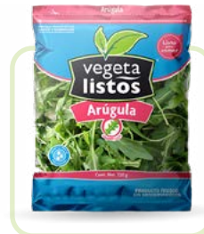
Arúgula Arugula Corte/cut: