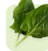
Espinaca Spinach Corte/cut: