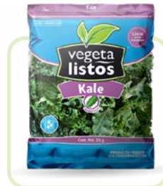
Kale Kale Corte/cut: