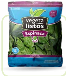
Espinaca Spinach Corte/cut: