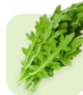
Arúgula Arugula Corte/cut: