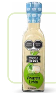
Aderezo Vinagreta Limón