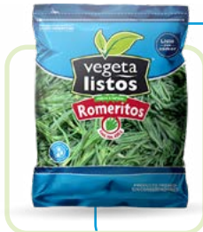
Romeritos Romeritos Corte / Cut: