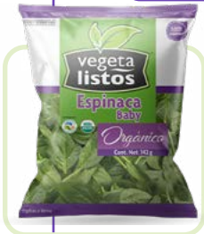
Espinaca Baby Spinach Baby Corte/cut: