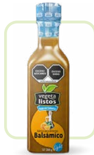
Aderezo Balsámico bajo en calorías