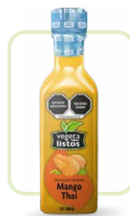
Aderezo Mango Thai